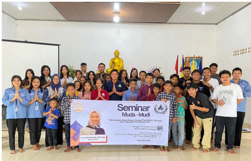
Gambar 3. Foto Bersama Narasumber & Peserta Kegiatan Seminar “Membangun Masa Depan Dengan Pendidikan Sebagai Kunci Melawan Pernikahan Dini”.

Hasil pengabdian menunjukkan tingkat pemahaman dan kesadaran peserta terkait pernikahan usia dini serta peran pendidikan dalam pencegahannya. Evaluasi dilakukan melalui pre-test dan post-test. Sebelum seminar, peserta diberikan pre-test untuk mengukur pemahaman awal, dan setelah seminar 23 peserta mengisi post-test untuk menilai peningkatan pengetahuan dan kesadaran. Analisis deskriptif terhadap skor pre-test dan post-test menunjukkan perubahan positif, yang mengindikasikan efektivitas seminar sebagai strategi edukatif nonformal.