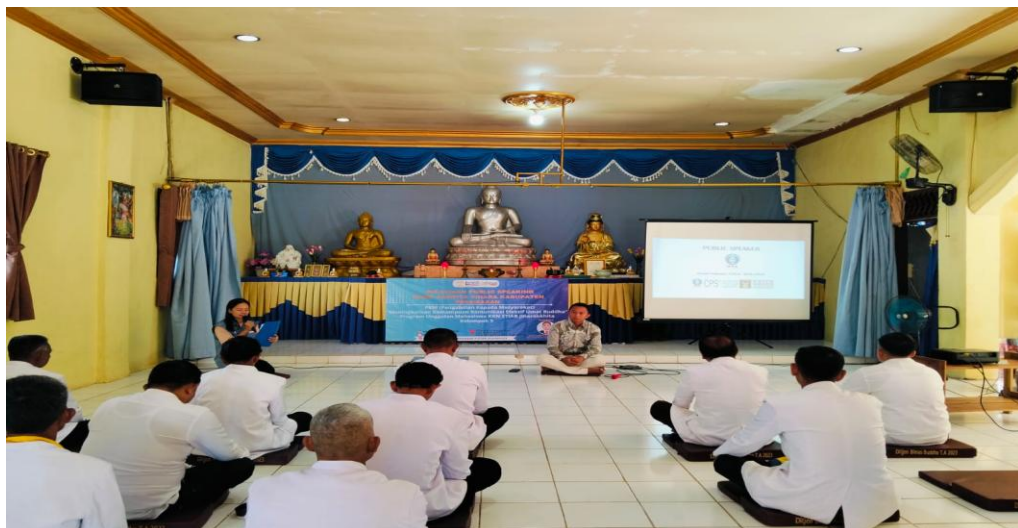
Gambar 1. Penyampaian materi

Hasil praktik menunjukkan bahwa integrasi konsep Public Relations dan nilai Sammavaca membantu peserta memahami bahwa komunikasi publik tidak hanya berorientasi pada penyampaian pesan, tetapi juga pada pembentukan sikap, citra, dan hubungan sosial yang berkelanjutan.