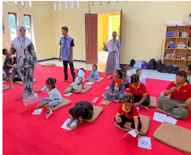
Gambar 4. Siswa SMB mengerjakan kuis