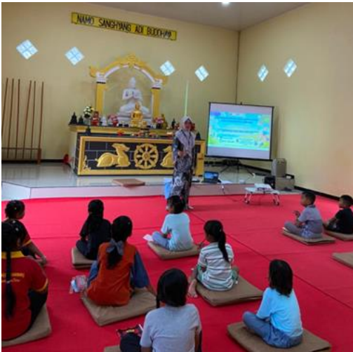
Gambar 3. Pemutaran Video TPR

untuk menirukan pelafalan tersebut guna memastikan bahwa mereka dapat melafalkan kosakata dengan benar. Selama proses ini, sebagian besar siswa menunjukkan kemampuan pelafalan yang cukup baik, meskipun beberapa di antara mereka terlihat ragu atau malu saat mengucapkannya. Namun, terdapat pula sejumlah siswa yang mampu melafalkan kosakata secara akurat. Selanjutnya, pemateri meminta para siswa untuk memperagakan kata-kata tersebut melalui gerakan, sehingga mereka dapat memahami arti dari setiap kosakata dengan lebih baik. Setelah menyampaikan materi, para siswa mengerjakan kuis berdasarkan materi dan praktek TPR yang telah dilaksanakan.