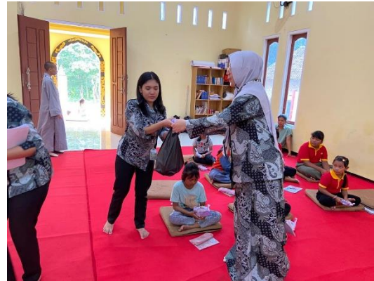
Gambar 5. Evaluasi Bersama Siswa SMB Gambar 6. Pemberian Hadiah kepada Siswa SMB

Dalam konteks proses belajar mengajar, metode Total Physical Response (TPR) memiliki sejumlah kelebihan, diantaranya: 1. Peningkatan Pemahaman Bahasa: Melalui penggunaan gerakan fisik, siswa dapat menghubungkan kata-kata dengan tindakan yang nyata, sehingga hal ini memudahkan mereka dalam memahami dan mengingat kosakata bahasa Inggris. 2. Merangsang Keterlibatan Aktif Siswa: Metode TPR mendorong siswa untuk berpartisipasi secara langsung dalam proses pembelajaran melalui pelaksanaan gerakan fisik. Dengan demikian, siswa menjadi lebih aktif dan terlibat dalam proses belajar. 3. Peningkatan Kemampuan Berbicara: Dengan mengintegrasikan gerakan fisik bersama penggunaan kata-kata, siswa akan merasa lebih percaya diri dalam berkomunikasi secara lisan dalam bahasa Inggris. Namun, terdapat pula beberapa kelemahan dari metode TPR yang dapat ditemui saat diterapkan dalam proses belajar mengajar, diantaranya: 1. Terbatas pada Tingkat Pemahaman: Metode TPR lebih sesuai untuk pemula atau siswa yang memiliki tingkat pemahaman yang rendah. Pendekatan ini mungkin tidak cukup menantang bagi siswa yang telah mahir dalam bahasa Inggris. 2. Terlalu Fokus pada Gerakan Fisik: Sebagian siswa mungkin tidak tertarik pada gerakan fisik atau merasa tidak nyaman dalam melakukannya, yang dapat berpotensi mengurangi efektivitas metode ini.