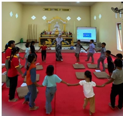
Gambar 2. Total Physical Response (TPR)

Metode Total Physical Response (TPR) merupakan suatu pendekatan atau strategi dalam pengajaran bahasa yang memanfaatkan gerakan fisik untuk mendukung pemahaman dan penguasaan kosakata serta struktur bahasa oleh para peserta didik. Dalam konteks pembelajaran bahasa Inggris, penerapan TPR dilakukan melalui beberapa pendekatan yang khas, antara lain: 1. Penggunaan Instruksi Fisik: Pengajar memberikan instruksi dalam bahasa Inggris, seperti "Berdiri" atau "Duduk", yang diikuti oleh respons fisik yang sesuai dari siswa. 2. Pemahaman Melalui Tindakan: Dalam metode ini, siswa mempelajari kosakata atau kalimat dengan melaksanakan gerakan fisik yang merepresentasikan makna yang sedang dipelajari. 3. Keterlibatan Aktif: Melalui gerakan fisik, siswa tidak sekadar mendengarkan atau mengulangi kata-kata, tetapi juga berpartisipasi secara aktif dalam proses pembelajaran, sehingga memperkuat daya ingat dan pemahaman mereka. 4. Pembelajaran yang Menyenangkan: TPR menjadi populer di kalangan siswa karena mengintegrasikan aktivitas fisik dan interaksi langsung, menciptakan suasana pembelajaran yang menarik dan menyenangkan. Metode ini terbukti efektif dalam membantu siswa, terutama di tingkat sekolah dasar, untuk mengembangkan keterampilan bahasa pasif dan aktif sekaligus memperluas kosakata mereka secara alami dan menyenangkan.