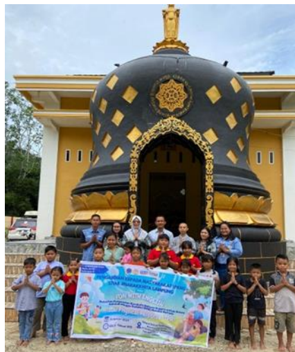
Gambar 1. Foto Bersama dengan Siswa SMB

Metode yang digunakan berupa pengajaran dan pelatihan pengenalan kosakata bahasa Inggris dengan mengimplementasikan Total Physical Response (TPR) pada siswa Sekolah Minggu Buddha (SMB) di Wihara Sakya Sasanang, Desa Karang Manik, Kecamatan Belitang II, Kabupaten OKU Timur, Sumatera Selatan pada hari Minggu tanggal 12 Januari 2025 yang dimulai pada pukul 08.00-selesai WIB. Materi yang disampaikan fokus pada kosakata dasar yang dekat dengan kegiatan mereka sehari-hari sehingga para siswa dapat memahami dan menggunakan kosakata yang diajarkan dengan tepat dan benar. Peserta pada kegiatan pelatihan pengenalan kosakata bahasa Inggris melalui metode Total Physical Response ini adalah para siswa Sekolah Minggu Buddha (SMB) yang duduk di kelas 3, 4 dan 5. Jumlah siswa yang ikut berpartisipasi dalam kegiatan ini sebanyak 17 orang.